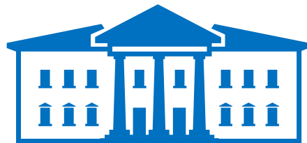
МУНИЦИПАЛЬНЫЙ ОРГАН УПРАВЛЕНИЯ ОБРАЗОВАНИЕМ (уполномоченная организация)