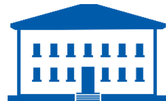
ОРГАНИЗАЦИЯ- ОПЕРАТОР (АУ УР «РЦОКО»)